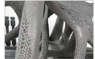
격자 구조를 위한 토폴로지 최적화