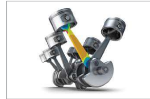
파워트레인 내구 해석의 완벽한 솔루션